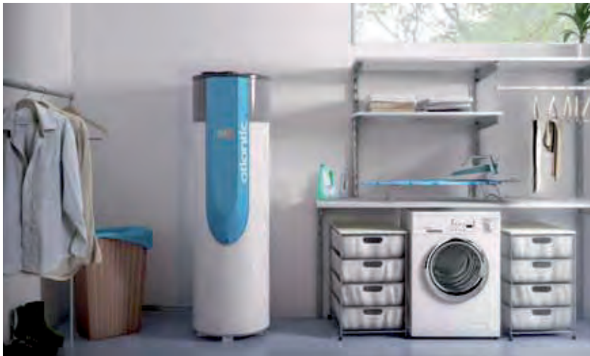
Als een warmtepompboiler zijn lucht in de woning zelf moet halen en afvoeren, plaatst u hem bij voorkeur in een niet-verwarmde ruimte.